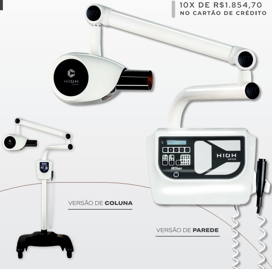
VERSÃO DE COLUNA